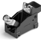
JTS 工具座 ..... 1 件 料号 JT-SF