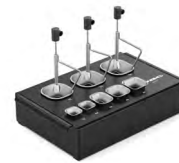
ESHT 保护罩和真空吸杆盒 ..... 1 件 料号 ESHT-A