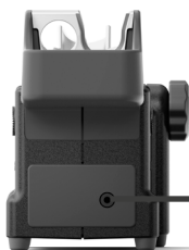
JTS JTT热风软管套装 专用工具座