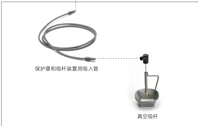
随ESHT保护罩和 真空吸杆盒配备