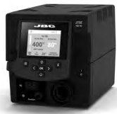
JTSE 热风主机 ..... 1 件 料号 JTSE-2HUA (230 V)