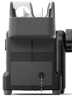
JTS 热风软管套装专用支架